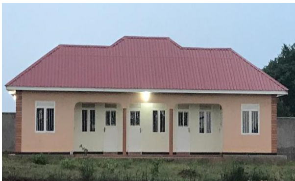
Lehrerunterkünfte mit Solar-Beleuchtung