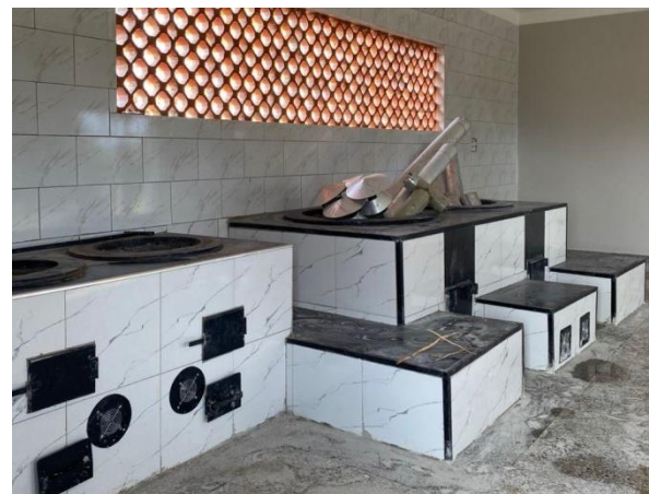
Küchengebäude mit Feuerstelle und Herd